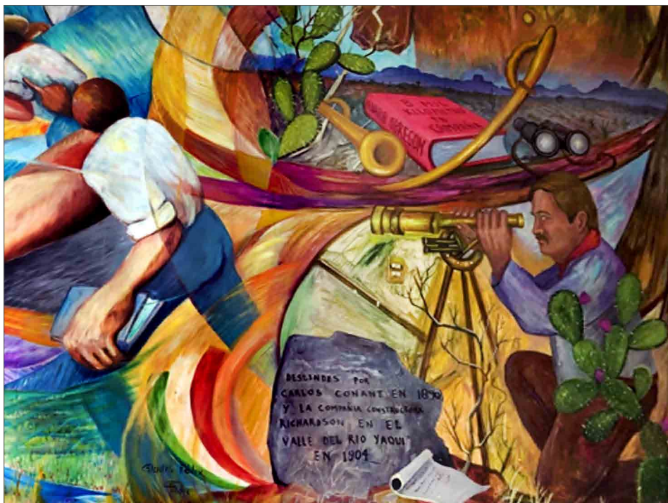
Detalle del mural en el Palacio Municipal de Ciudad Obregón, Sonora.

Cuando Obregón llegó a la presidencia de la República promovió la celebración de un nuevo contrato entre la Secretaría de Agricultura y Fomento y la Compañía Richardson, con la idea de continuar con el aprovechamiento de las aguas del río Yaqui, en noviembre de 1922. La diferencia que trajo este contrato a la región fue que, a partir de entonces, la compañía quedó obligada a proporcionar de forma gratuita las aguas necesarias para el uso doméstico a los habitantes de la región y a los ayuntamientos de los alrededores. Cuatro años más tarde, el Banco Nacional de Crédito Agrícola entró en funciones. Para ese momento, el interés en el Yaqui estaba en fomentar las operaciones de crédito con el objetivo de llevar a cabo proyectos de agricultura comercial. También para esos años, los canales construidos por la Richardson eran insuficientes para abastecer los riegos necesarios en el valle, por lo que Álvaro Obregón como empresario, ya no como presidente, presentó ante el Banco junto con William Richardson y