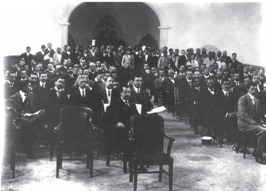
Aspecto del salón durante la primera sesión.

Con la llegada de 1916, los principales grupos opositores del constitucionalismo —villistas y zapatistas— estaban deshechos, no obstante, seguía habiendo levantamientos a lo largo y ancho del país. Obregón y González fueron los encargados de apagar esos levantamientos.