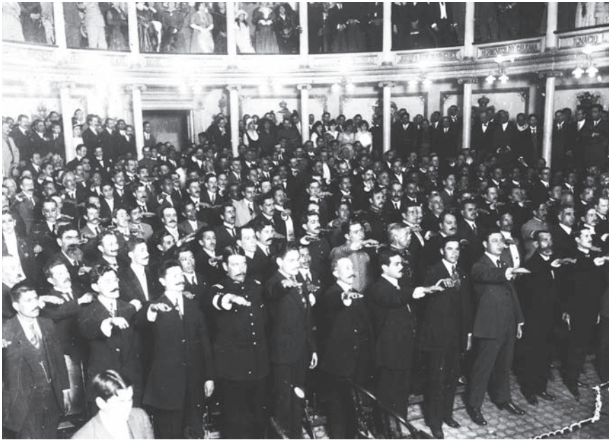
Los diputados protestan cumplir la nueva Constitución.