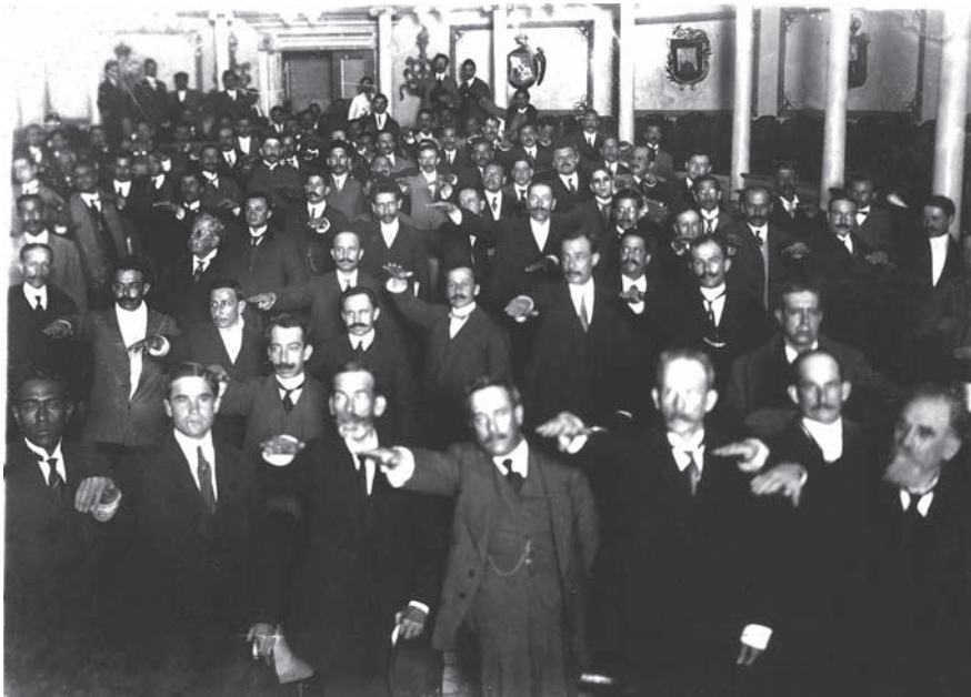
Los diputados rindiendo protesta.