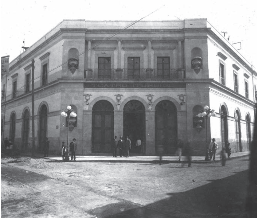
Teatro Iturbide, donde se celebraron el resto de las sesiones.