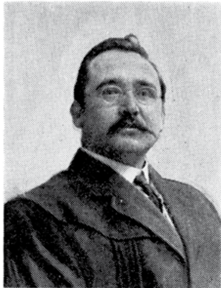
GRAL. ESTEBAN BACA CALDERON

Nació el 6 de mayo de 1876, en Acuitlalpico, Santa María del Oro, Nay. Murió el 29 de marzo de 1957, en Nuevo Laredo, Tamps.