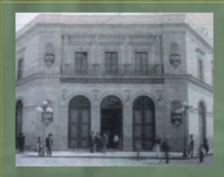
Teatro Iturbide, hoy Teatro de la República, en Querétaro de Arteaga.

En la ciudad de Querétaro, entre 1916 y 1917, 218 diputados se reunieron en lo que pasaría a la historia como el célebre Congreso Constituyente. Allí se dieron a la tarea de discutir las propuestas presentadas por Venustiano Carranza y crearon una de las más importantes gestas doctrinales en la historia del país.