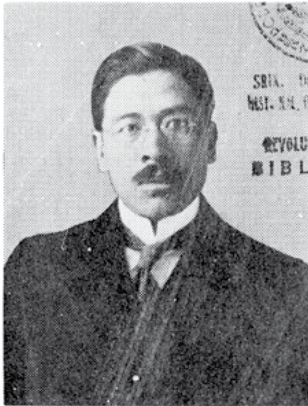
LIC. ALBERTO TERRONES BENITEZ

Nació el 3 de julio de 1887, en la Villa de Nombre de Dios, Municipio del mismo nombre, Dgo. Estudios primarios en varios pueblos de esa entidad; secundarios en la capital del Estado y en el Instituto Juárez de la misma ciudad. Se tituló como abogado en 1910. En 1911 inició sus actividades profesionales en Guanaceví, Dgo. Posteriormente obtuvo la credencial de Perito Minero. En 1914 colaboró con la Secretaría de Relaciones Exteriores. Diputado al Congreso Constituyente de Querétaro 1916-1917, por el 6º Distrito Electoral de Durango. Organizador y dirigente del Sindicato de Campesinos Agraristas de aquel Estado 1918-1930. Diputado Suplente a las XXVIII, XXIX y XXX Legislaturas del Congreso de la Unión. En 1924-1926 Senador de la República. Gobernador de Durango, 1929-1931. Abogado Consultor del Departamento Agrario, 1934-1935. Asesor en las convenciones de Pequeños Mineros. Representante del Gobierno del Estado de Durango ante el Gobierno Federal de 1946 a 1952. Senador de la República en el sexenio 1952-1958. Igual cargo desempeña en la actualidad.