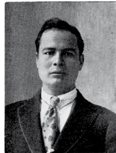
JUAN DE DIOS BOJORQUEZ

Obras: El Problema de la Educación Popular , México, 1922.