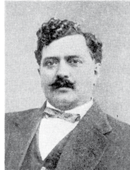
GRAL. HERIBERTO JARA CORONA

En 1913 se opuso a la usurpación huertista, y al triunfo del constitucionalismo asistió al Congreso Constituyente 1916-1917 como diputado por el 3er. Distrito Electoral de Jalisco, correspondiente a Zapopan.