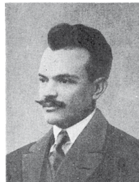
GRAL. FRANCISCO J. MUGICA

Recibió la Medalla Altamirano como reconocimiento a su labor educativa.